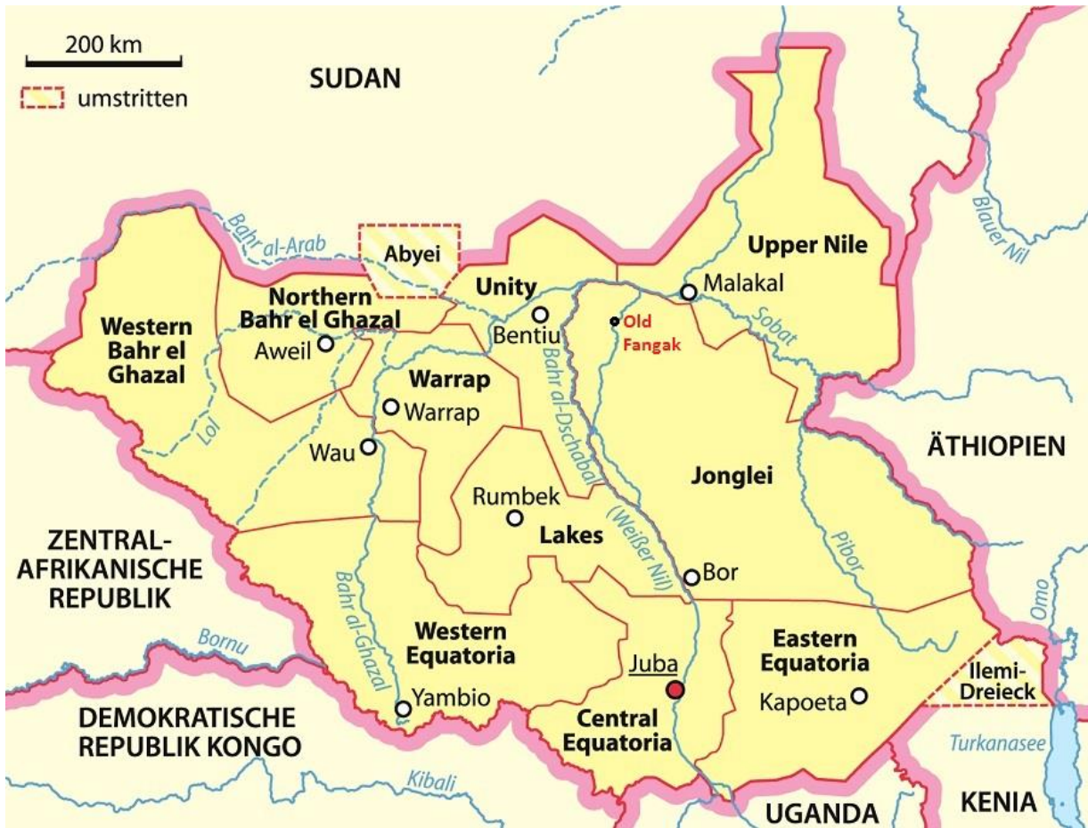
2 Karten: Old Fangak im Südsudan und Statistik zur Krise